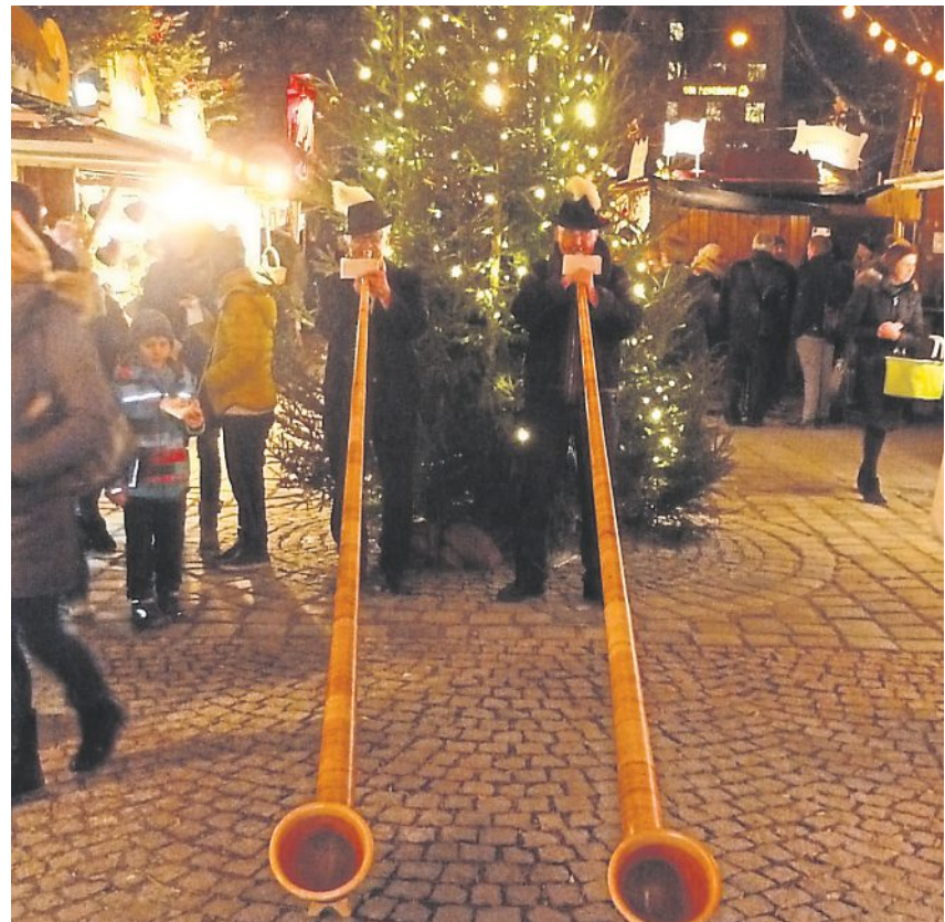
Die Alphornbläser „Münchner Spitzbuam“.

Täglich von 11 – 20.30 Uhr öffnet der Markt seine Pforten und bietet an liebevoll dekorierten Verkaufshütten eine breite Auswahl an Christbaumschmuck, Krippenfiguren, Seifen,