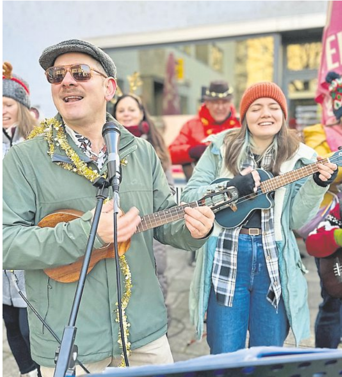
Die Mitglieder des Munich Ukulele Collective laden zum gemeinsamen Musizieren und Spaß haben ein

Musikalischer Mitmach-Abend in der Neuhauser Stadtbibliothek