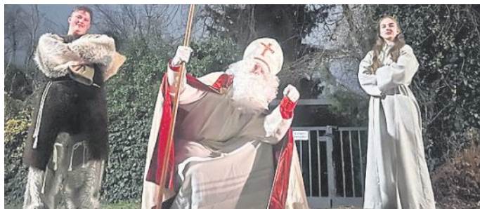
Engagierte Jugendliche: Am Nikolaustag überrascht die Pfarrjugend Allach Familien als Nikolaus, Engel und Krampus.

Bei Fragen oder Interesse können sich Interessierte gerne auch an die Pfarrjugendleitung wenden – E-Mail: allach.pfarrjugend@gmail.com