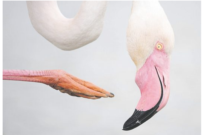
Die Ausstellung zeigt Tierporträts – außergewöhnlich und künstlerisch inszeniert.