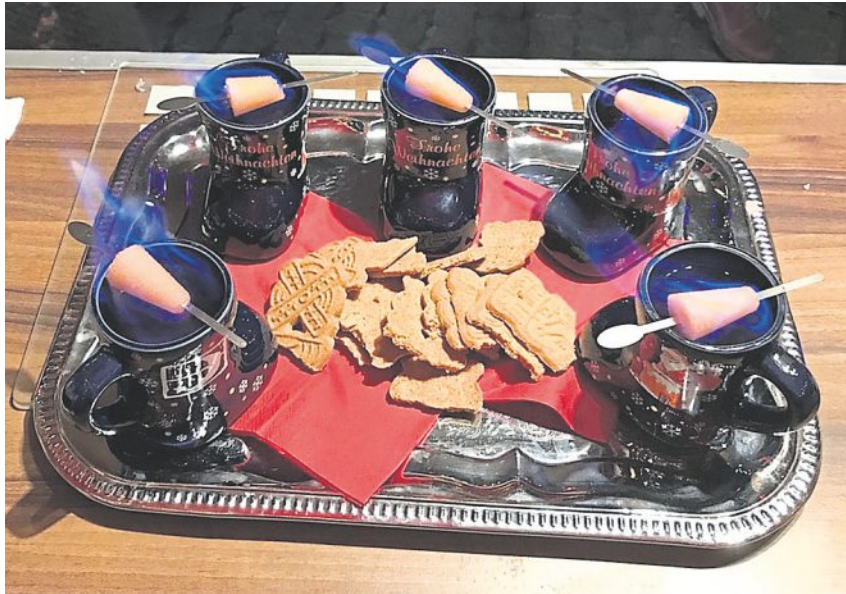
Zum Aufwärmen: eine köstliche hausgemachte Feuerzangenbowle zum Selberanzünden.

Der Neuhauser Weihnachtsmarkt (direkt an der U-Bahn-Haltestelle Rotkreuzplatz) ist bis zum 23. Dezember täglich geöffnet.