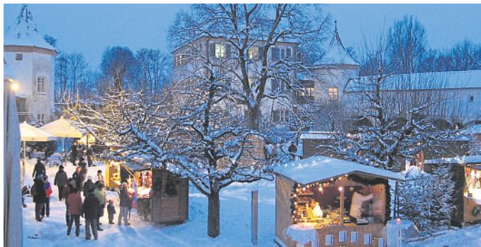
Traumhaftes Ambiente: der festlich beleuchtete Innenhof von Schloss Blütenburg.

Märchenhafte Winterwunderwelt rund ums Schloss