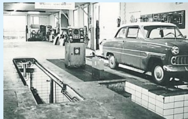
Die Werkstatt von innen