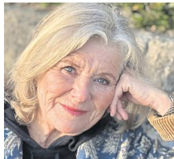
Jutta Speidel, Schauspielerin