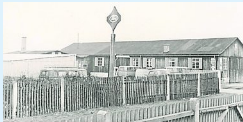
Außenansicht des Werkstattgebäudes anno 1945