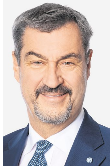
Markus Söder, Bayerischer Ministerpräsident

Herzlichen Glückwunsch zu 20 Jahren „Hallo München“, für die Zukunft alles Gute!