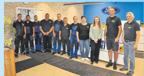
Das aktuelle Team freut sich auf Ihren Besuch